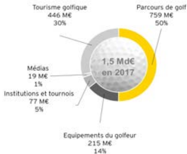
L'impact économique de la filière golf en France en 2017

L'économie française du golf a généré un chiffre d'affaires de 1,5 Md€ en 2017 dans une variété d'activités : exploitation de parcours et pratiques de golf (50%), fournisseurs de la filière (14%), institutions golfiques et organisateurs de tournois (5%), médias dédiés au golf (1%)... Grâce à sa dynamique touristique, la filière du golf a, dans son périmètre le plus étendu, un impact considérable sur les secteurs variés des loisirs et de l'hôtellerie-restauration (30%).